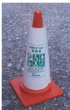
【駐車場での設置例】